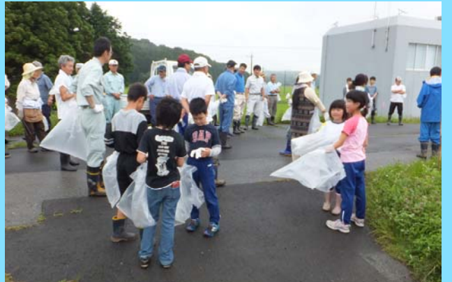
H24年(第22回) 鬼怒川・小貝川クリーン大作戦実施状況